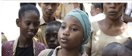
Demain est à nous